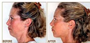
Keep your face and neck looking young and beautiful.

Dramatic Results In Just 2 Minutes A Day