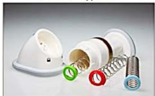
напряжение регулируется пружинами