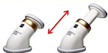
тренажер для подбородка;